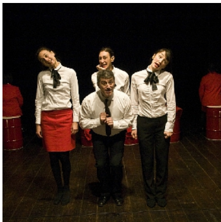
Lavoravo all'Omsa

Sono vestite di rosso, hanno lo sguardo fermo e lucido, il passo è deciso, la motivazione è forte, molto forte, sono principalmente donne e sono licenziate. Le osservo giungere da lontano, irrompono con vigore nell'affanno consumistico di un qualsiasi sabato pomeriggio, un fischietto avverte della loro presenza, e improvvisamente è una marcia a travolgere ogni residuo di curiosità. In molti si domandano chi siano queste donne che sfidano con grande consapevolezza una delle vie più altolocate di Bologna. Eppure sono pochi i passanti che sentono la necessità di fermarsi. D'altronde, che la diffidenza e il disinteresse misurino con precisione la temperatura di una città dimentica dei suoi più celebri appellativi, è cosa ormai nota.